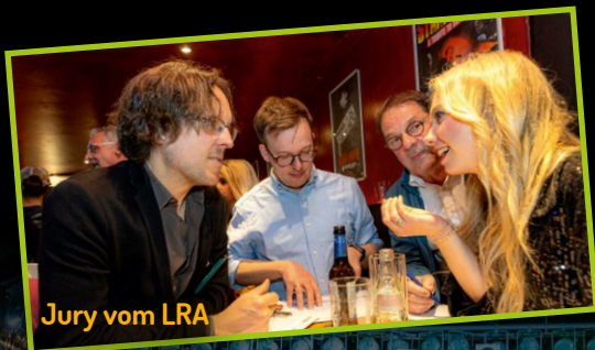
Jury vom LRA

Die Sieger „EARWAVES“ von 2025 spielen am Freitag, den 17.4.26 als Support von „MARIGOLD“ bei uns!